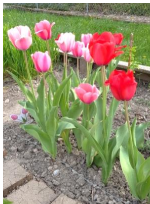
15 avril 20