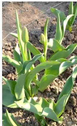
1 avril 20