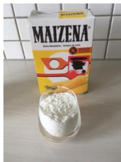
1 verre de maïzena