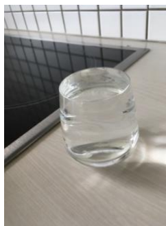
1 verre d'eau